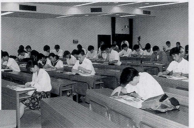
理学部ガイダンス風景

母親と初めて東広島にやって来た附属高校在学中のお嬢さんに終了後簡単な質問を投げかけてみた。 “広大に来る前と現在とでは一番の驚きは何でしたか？” “初めてキャンパスを見て、広さにびっくりしました。頑張って広大にこられたら”と健気な苦笑がかえってきた。