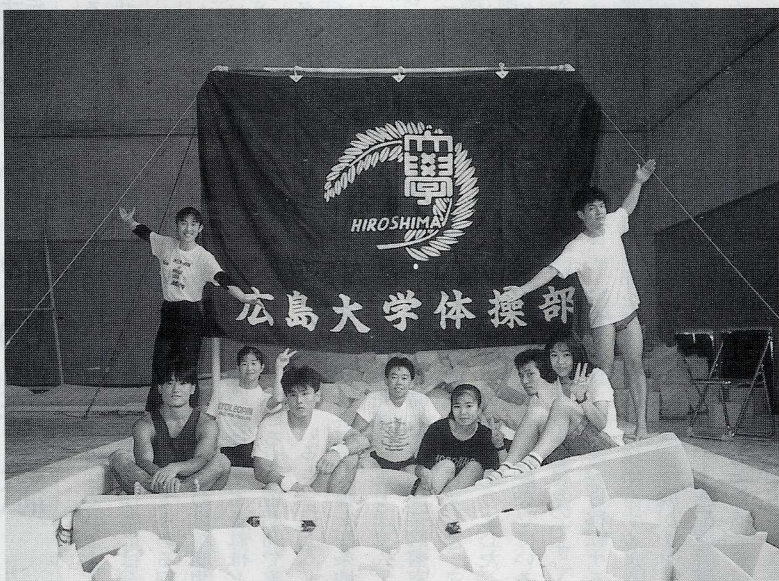
新入生の皆さん! 体操部です (於 北体育館)

みんな楽しく、一生懸命活動していますが、部員が少ないというのほさみしいものがあり、新入部員の入部を期待してい