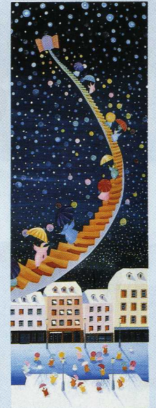
■イヴェール・ブラン (白い冬) 広大フォーラム7号

大阪の水族館を見に行った時の海の底がとても神秘的でした。空も、海も同じ空気を感しました。