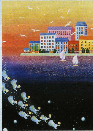
■アストロロジィー (星占い) 広大フォーラム3号

これを描いているときは画面と話をしているような感じでした。妖精達のざわめきや、奏でるハーモニーはもちろん、赤や青や黄色の絵の具達も声を出して語りかけてくるのです。