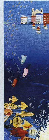
■ルラ・ポワソヌー (魚がたくさんいる湖) 広大フォーラム7号

子どもの時から、よく空を飛ぶ夢を見ていました。ベッドに寝たまま飛んでいたり、どこまでもハシゴに昇っていたり……。