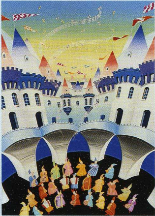
■ポルト・デ・リラ (藤色の門) 広大フォーラム2号