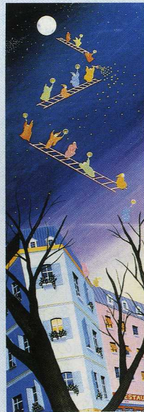
■ルネ・ブルー (青い月) 広大フォーラム7号

広島市のシンボル平和の塔、原爆ドーム、植物公園の花、明るい日差し、初めてここへ来た時からいつか描きたいと思っていた広島の街。こういう街であってほしいという私の憧れも込めて。