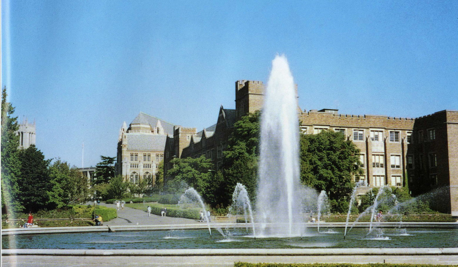
▲キャンパス中央にある Drumheller Fountain (ドラムヘラー噴水)