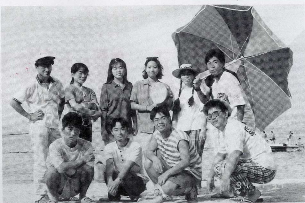
平成6年度リーダーズ・トレーニング