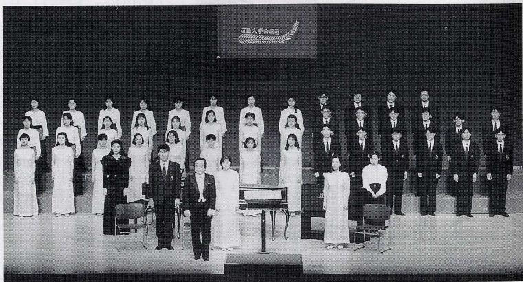
広島大学合唱団定期演奏会