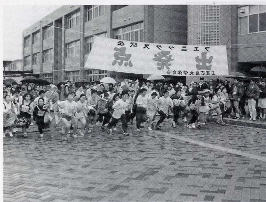
体育会主催 第32回フェニックス駅伝(平成6年12月11日(日))

もし体力に自信がなく、クラブに入る気がないのなら、少なくとも体育会に入会することを勧める。クラブ以外でも課外活動を充実させることは可能だが、そういう選択をしようとする君