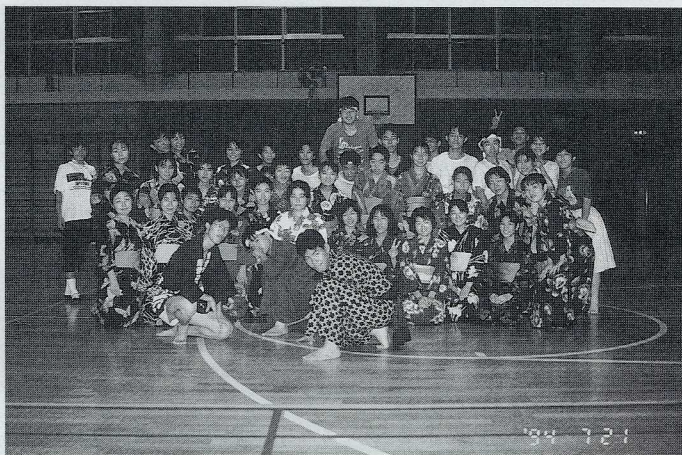
夏合宿での全体写真