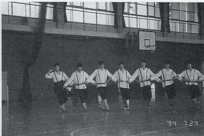
練習風景（ブルガリアの踊り）

このフォーラムをご覧になり、少しでも興味をもたれた方がいらっしゃれば、東千田・西条どちらの体育館でもちよつと覗いてみてください。男女とも明るく楽しい奴らばかりのわがフォークダンス部が、あなたを魅惑の世界へお連れいたします。（かがわ・つよし）