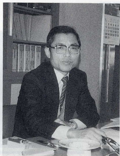
若かりし頃の施設部事務室にて

昨年、阪神大震災、オウム事件、バブル経済崩壊による経済不況など暗いニュースの続いた中で、広島大学にとっては長年の懸案であった統合移転を完了し、記念すべき年になり大変おめでとございました。