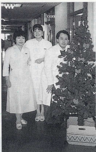
クリスマスツリーの飾り付けをした後、チーズ

昭和四十三年から医学部附属病院にお世話になりました。月日のたつのは早いもので、東病棟四階に勤務してはや二十八年の歳月が流れ、数々の思い出が走馬灯のごとく、脳裏を駆けめぐります。